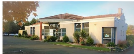
Siège de l'association

Le siège de l'association est basé à Machecoul-Saint-Même (44).